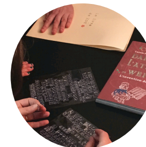
... et manipulation concrète.