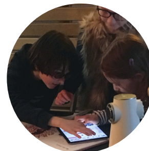
Usage collectif de la tablette...

« encrer les lettres », « les animations sur la tablette », « faire les jeux et répondre aux questions », « l'imprimerie ».